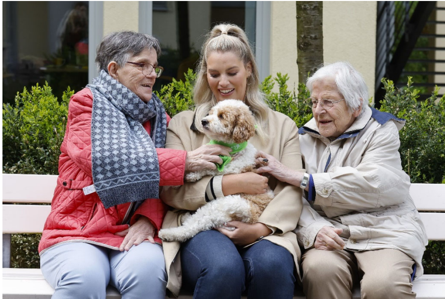
Hundedame Leny ermöglicht Angelina Kirsch und Bewohnerinnen des Seniorenheimes tolle gemeinsame Momente und Gespräche.

PURINA-Markenbotschafter:innen und TV-Moderator:innen Angelina Kirsch und Jochen Bendel: Gemeinsamer Besuch im Seniorenheim mit dem Verein Tiere bauen Brücken e.V.